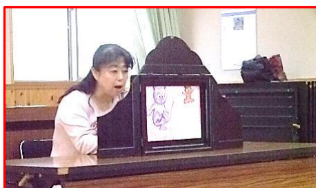
【紙芝居の 始まり 始まり！】