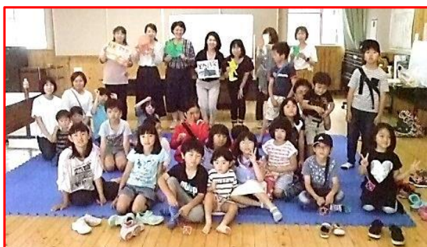
【みんなで一緒に ハイ・チーズ！】