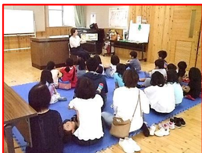
【ジャイアンとジャムサンド】

絵本や紙芝居の生の声でお話を聞くことは、子どもの情操教育に一番大切なことです。集中力と創造力の豊かな子どもが育ちます。工作で物を作る楽しさは工夫をする知恵が身に付きます。