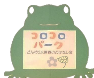
【かえりの プレゼントは “カエル”】