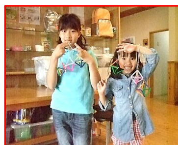
【かんたんにできましたよ】