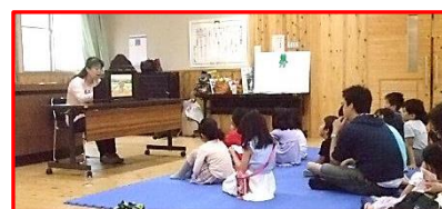
【大きい猫 小さい猫】