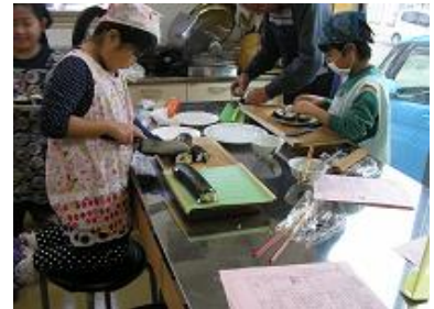
③ 上手に切れるかな？