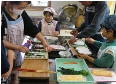
① 酢飯をきれいに広げて 具をのせます。

2月27日（土）に9家族19人の参加で家族料理教室が行われ楽しくみんなと協力しながら『創作すし』にチャレンジしました。 その中の1家族はおじいちゃんとの参加でとても微笑ましかったです。 今日は、切るとばらの花が現れる巻きすしとすまし汁を作りました。