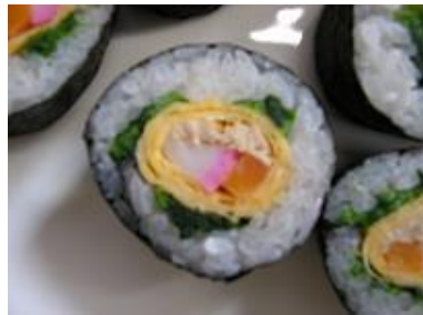
⑤ ばらの花の巻きすし完