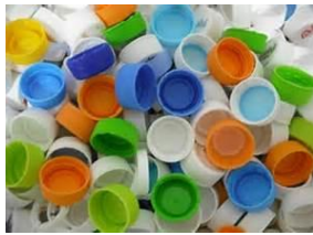
公民館で集められた ペットボトルキャップ