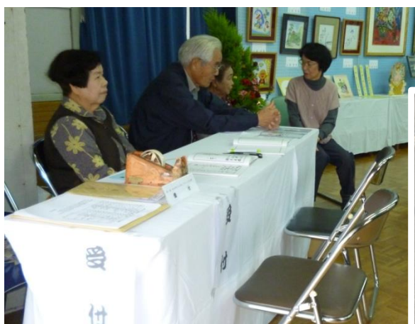
受付で出品者名簿の配布！

町内会の各団体が協力して開催することができ、佐波町内会の「地域力」がうかがえる、素晴らしい作品展でした。