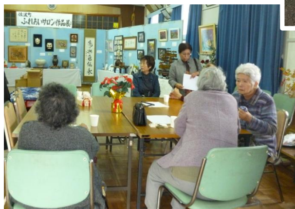
お茶とお菓子が振る舞われ談笑