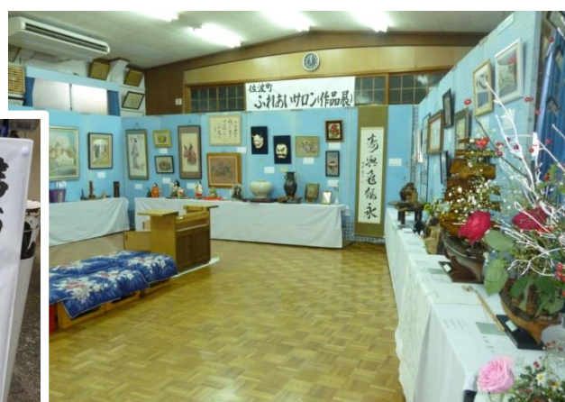
会場いっぱい並んだ作品