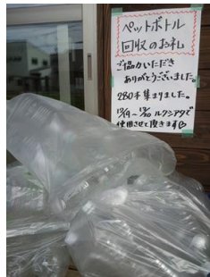
《キャンドル用ペットボトル回収しました》